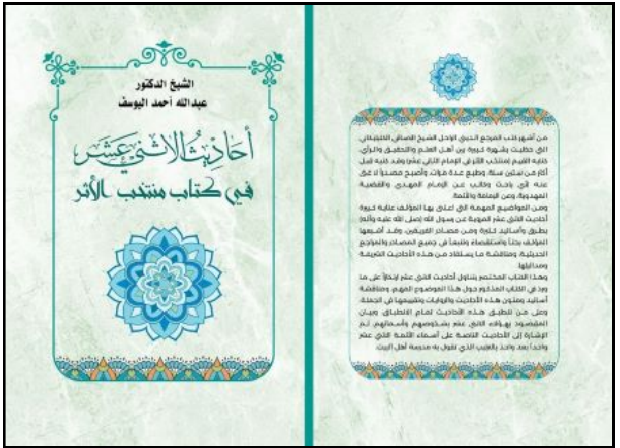
غلاف كتاب: الأحاديث الاثني عشر في كتاب منتخب الأثر ط. 1، 1443هـ - 2022م